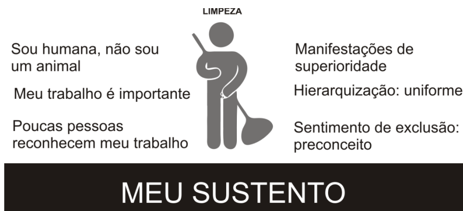
Figura 3. Manifestação do sentimento de invisibilidade socioprofissional

A síntese das unidades de sentido categorizadas encontra-se na figura 3, a seguir.