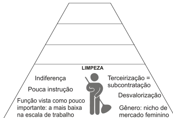
Figura 2. Aspectos que fazem com que o serviço de limpeza ser pejorativamente visto

A invisibilidade socioprofissional acontece quando os trabalhadores percebem a indiferença dos demais sujeitos que compõem a instituição, visualizando sua atividade como negativa e marginal. Isso acaba por legitimar as hierarquias que compõem uma organização, excluindo profissões que não possuem status, glamour ou poder (Celeguim & Roesler, 2009). Ninguém na organização deseja aquele local socioprofissional porque ele é sinônimo de falta de estudo e trabalho braçal. O resultado disso é a humilhação e o sentimento de invisibilidade por parte do profissional. Na figura 02 é possível observar tais aspectos.