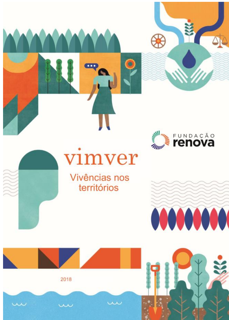
FIGURA 2: Capa do VimVer: vivência nos territórios