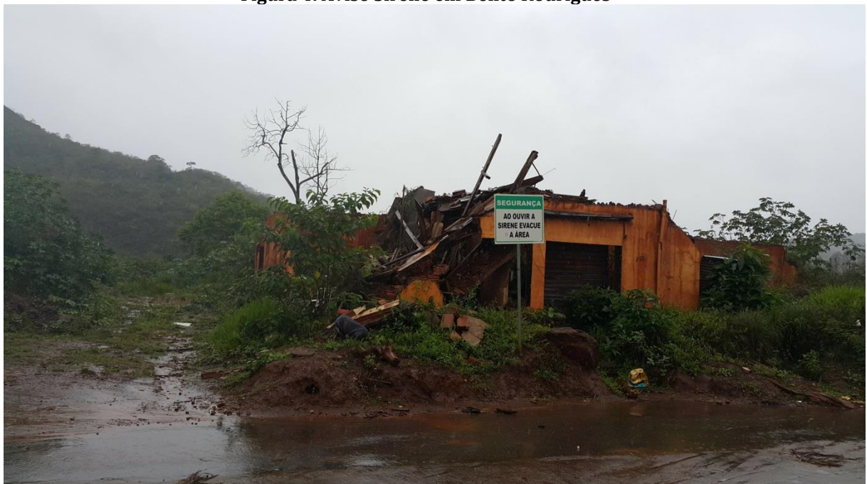
Figura 4: Aviso Sirene em Bento Rodrigues

Atualmente, há na comunidade de Bento Rodrigues a indicação de trechos de “zona quente” e zonas de autossalvamento (ZAS) com os “pontos de encontro” das pessoas em caso de rompimento da barragem de Fundão. Há, inclusive, um sistema de sirene. Todas essas medidas obrigatórias de segurança foram instaladas em Bento Rodrigues após o colapso da barragem, ocorrido em 2015. Ressalta-se que a comunidade tornou-se inabitável por causa da destruição provocada pelo rejeito de Fundão.