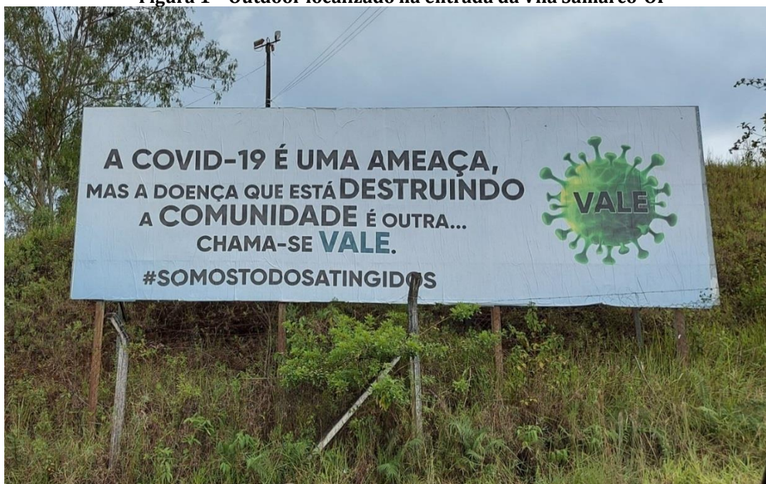
Figura 1 - Outdoor localizado na entrada da Vila Samarco-OP

Mais elementos da ação necrófila da mineradora podem ser vistos por quem trafega pela BR-126, sentido às mineradoras Vale e Samarco. Na entrada da Vila Antônio Pereira (Vila Samarco) havia um chamativo outdoor com os seguintes dizeres: “a COVID-19 é uma ameaça, mas a doença que está destruindo a comunidade é outra... chama-se VALE”, acrescida da hashtag #SOMOSTODOSATINGIDOS (Figura 1).