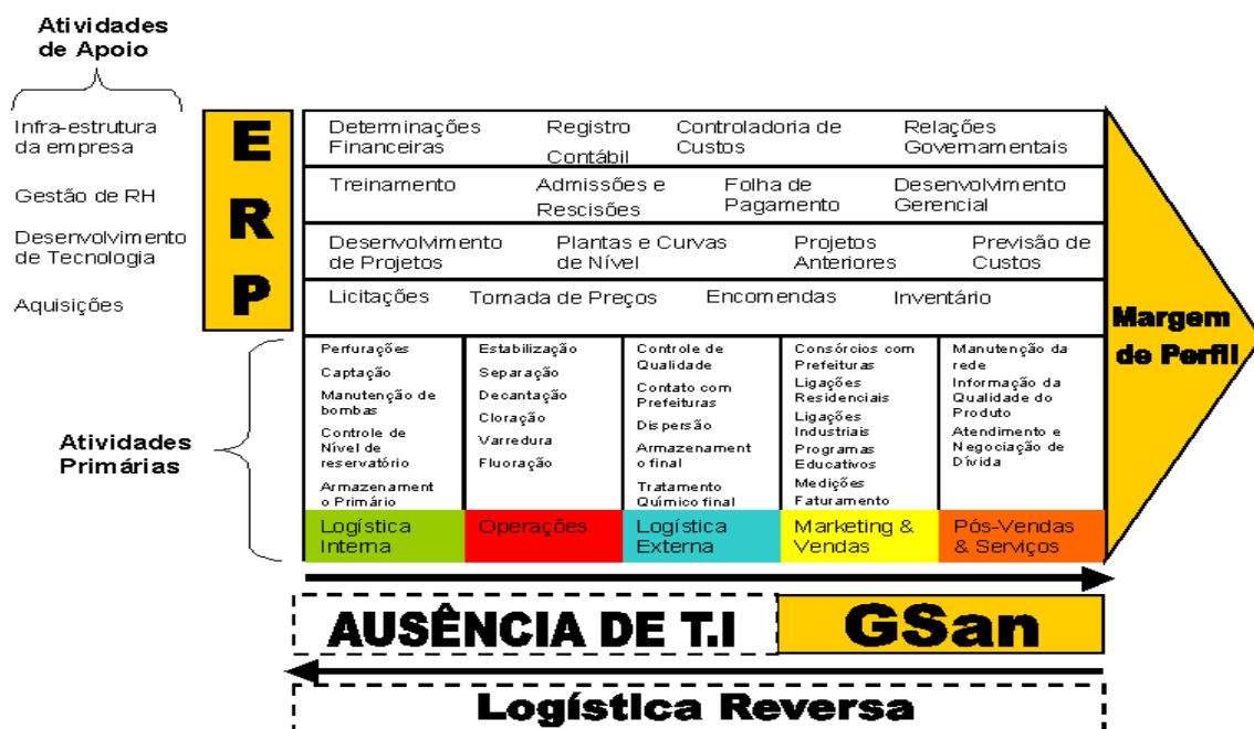
Figura 4 – Cadeia de valor CAERN

tratamento de água da CAERN possui uma contrapartida, embora não universal, de recolhimento das águas utilizadas domesticamente e industrialmente, caracterizando-se em esgoto.