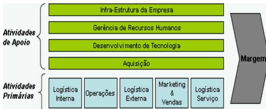
Figura 2 – Cadeia de valor de Porter

Outra importante tipologia de Porter (1985) é a cadeia de valor. As atividades exercidas por uma organização são agrupadas em atividades primárias e de apoio. As primeiras estão divididas em: 1- Logística Interna; 2- Operações; 3- Logística Externa; 4- Marketing & Vendas; 5- Pós-Vendas & Serviços. As atividades de apoio se dividem em: 1- Infraestrutura da empresa; 2- Gestão de RH; 3- Desenvolvimento de Tecnologia; 4- Aquisições, conforme figura 2. Observando este conceito, percebe-se que a cadeia de valor é a consecução dos esforços de uma organização na busca por sua vantagem competitiva.